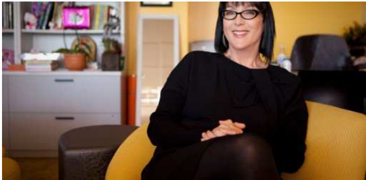
( http://ischool.startupitalia.eu/37417/startup/lynda-video-learning/ )