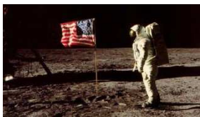
( http://ischool.startupitalia.eu/37210/lavoro-usa/ )

Lynda Weinman ha fondato il sito lynda.com nel 1995 per parlare con i suoi studenti e lettori: non immaginava che sarebbe diventato un e-learning da 4 milioni di utenti