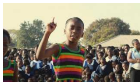
( http://ischool.startupitalia.eu/37390/stage-zambia/ )

Lo stage da Twitter e altre 3 super offerte di lavoro negli Usa ( http://ischool.startupitalia.eu/37210/lavoro-usa/ )