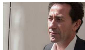
( http://ischool.startupitalia.eu/37379/startup/nannini-impact-hub-come-fare-impresa-scuola/ )